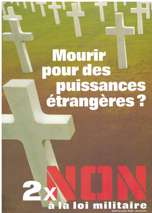
Il corso NATO a Berna solleva «vecchie questioni».

Il est plus facile pour la conseillère fédérale Amherd de suivre le courant que de faire appel à sa propre force à des fins de médiation. C'est une erreur très grave, car la neutralité de la Suisse est inscrite dans notre Constitution. La Suisse doit rester une tache blanche et neutre